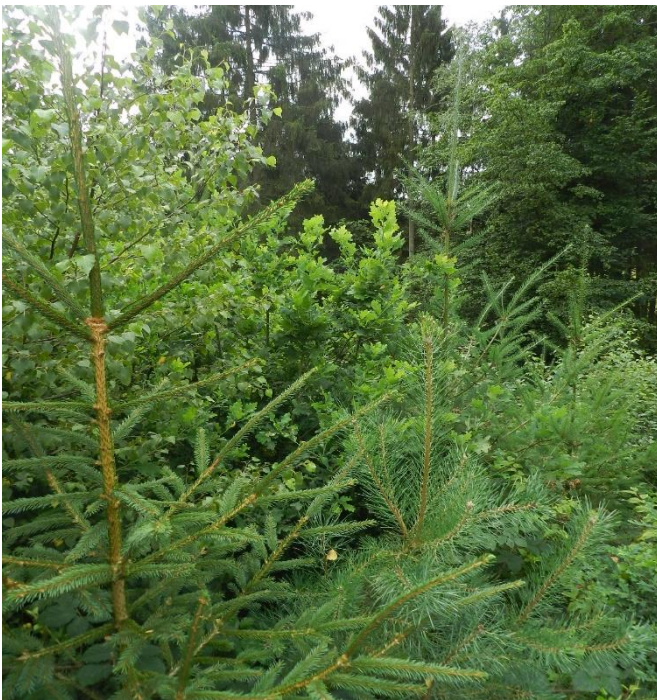
Abb. 3: Eine artenreiche Waldverjüngung ersetzt Fichtenforst. Netzwerkrevier Siedenberghardt

In NRW gibt es kaum Gemeinschaftliche Jagdbezirke, in denen artenreiche Waldverjüngungen (Abb. 3) zu finden sind. In den meisten dieser Reviere wird Rehwild traditionell bejagt. Selektive, an Trophäen orientierte Hegejagd findet ausschließlich im kompensatorischen Bereich statt (d.h. es wird Jahr für Jahr weniger erlegt als „nachwächst“) und wirkt daher nicht regulierend. In allen Revieren des Netzwerks, also Revieren mit „funktionierender“ Walderneuerung, wurde die traditionelle Bejagung beendet und die Jagdstrategien verändert. Das zeigt sehr deutlich, dass ohne eine Änderung der Jagd keine Waldverjüngung möglich ist, die den Ansprüchen des allgemein anerkannten, zwingend notwendigen „Waldumbaus“ genügt. Eine konsequente Rehbejagung mit zeitgemäßen Jagdmethoden ist zielführend (Vgl. Heute 2016).