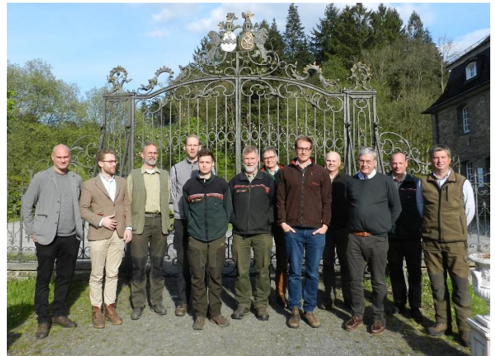
Abb. 3: Mitglieder des Netzwerks am 14.5.2019 bei Bussche-Kessell in Lüdenscheid

Die effektive Schalenwildbejagung in artenreichen, naturverjüngten und damit deckungs- und äsungsreichen Wäldern ist die vielleicht größte Herausforderung, vor der die Jägerschaft steht. Im Netzwerk sollen, aus den mannigfaltigen Erfahrungen der Reviere, Handlungsempfehlungen für den Jagdbetrieb abgeleitet werden. Hierzu findet ein intensiver fachlicher Austausch über erfolgreich praktizierte Jagdstrategien in den Netzwerkrevieren statt (Abb. 4). Die Ergebnisse des Netzwerkprojektes sollen als Referenz herangezogen werden können von Jägern (und Waldbesitzern), z.B. im Vergleich mit den Ergebnissen aus den Verbissgutachten des Landesbetriebs Wald und Holz NRW. Das Netzwerk tritt für eine sachliche und datenbasierte Erörterung sowie Darstellung der nachhaltigen Rehbejagung ein. Erkenntnisse des Projekts sollen der Jägerschaft leicht zugänglich gemacht werden. Interessierte, sachliche Jäger/innen sind eingeladen, sich auf Exkursionen in den Revieren über das Projekt zu informieren bzw. sich einzubringen.