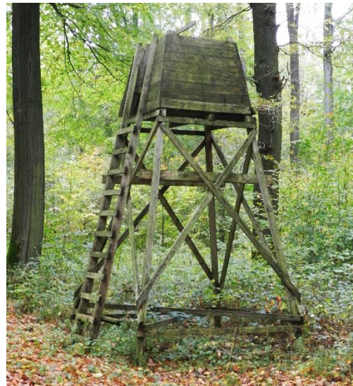
Abb. 2: Hohe, offene Kombisitze wie diese „Boscor-Kanzel“ kommen verstärkt zum Einsatz

Die meisten Netzwerkreviere änderten in den „Nullerjahren“, zwischen 2003 bis 2009, ihre Jagdstrategien. In allen Revieren mit Ausnahme des o.g. Pachtrevieres, wird seither in Eigenregie gejagt. Das heißt, dass die Reviere nicht mehr verpachtet wurden, sondern entweder von Begehungsscheininhabern in Pirschbezirken oder dem eigenen Forstpersonal unter Einbeziehung von „Jagdhelfern“ und Gästen bejagt werden. Die „Jägerdichte“ wurde auf einen Jäger pro 55 Hektar Waldfläche erhöht (Jäger, die andauernd im Revier jagen: Begehungsscheininhaber, „Jagdhelfer“, Forstpersonal etc.). Im Laufe der Jahre wurde das Netz an Ansitzeinrichtungen auf einen Ansitz pro acht Hektar Wald erhöht (Stand 2017). In den Revieren wurde der Abschuss des Rehwilds fast vervierfacht. Durchschnittlich wurden in den letzten fünf Jagdjahren 12,9 Rehe pro 100ha Wald erlegt. Der Abschuss erfolgte zu 72% bei der Ansitz- und zu 28% im Rahmen von Bewegungsjagden.